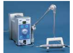
Подвесной держатель для наконечника (приобретается отдельно)

Дополнительный держатель для наконечника позволяет максимально освободить рабочую поверхность, так как наконечник не занимает места на столе. Длина держателя регулируется.