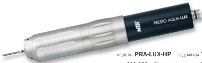
МОДЕЛЬ PRA-LUX-HP КОД ЗАКАЗА T1002

Не требующий смазки турбинный наконечник с технологией LED и водяным охлаждением