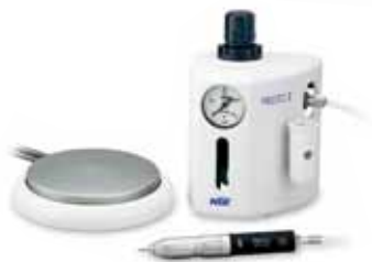
МОДЕЛЬ PRESTO II КОД ЗАКАЗА Y150022

Комплектация: • Блок PRESTO II • Наконечник PRESTO • Подставка для наконечника • Воздушный шланг PRESTO • Педаль (AFC-40) • Дополнительный воздушный шланг для PRESTO