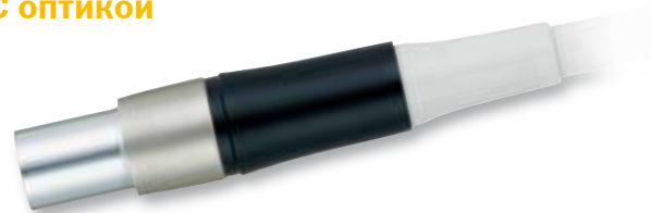
МОДЕЛЬ Воздушный шланг PR-AQL КОД ЗАКАЗА Z1050