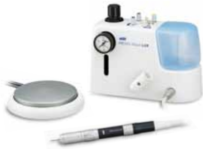
МОДЕЛЬ PRESTO AQUA LUX (120B) КОД ЗАКАЗА Y1001199