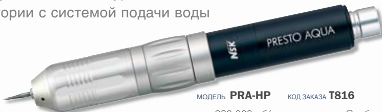
МОДЕЛЬ PRA-HP КОД ЗАКАЗА T816

Не требующий смазки турбинный наконечник для лаборатории с системой подачи воды