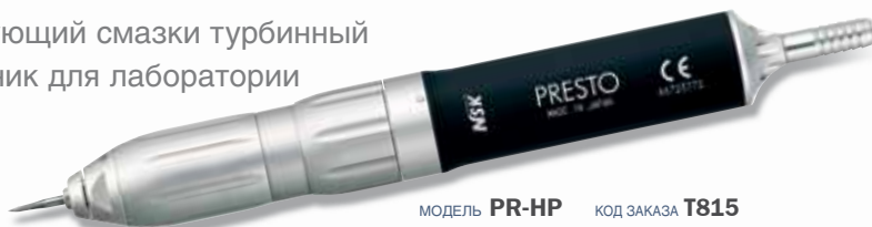
МОДЕЛЬ PR-HP КОД ЗАКАЗА T815

Не требующий смазки турбинный наконечник для лаборатории