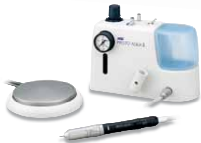
МОДЕЛЬ PRESTO AQUA II КОД ЗАКАЗА Y150023

Комплектация: • Блок PRESTO AQUA II • Наконечник PRESTO AQUA • Переходник QD-J B3 • Воздушный шланг PRESTO AQUA II • Педаль (AFC-40) • Дополнительный воздушный шланг для PRESTO