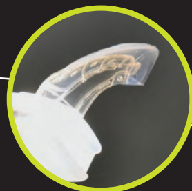
Ретрактор для языка