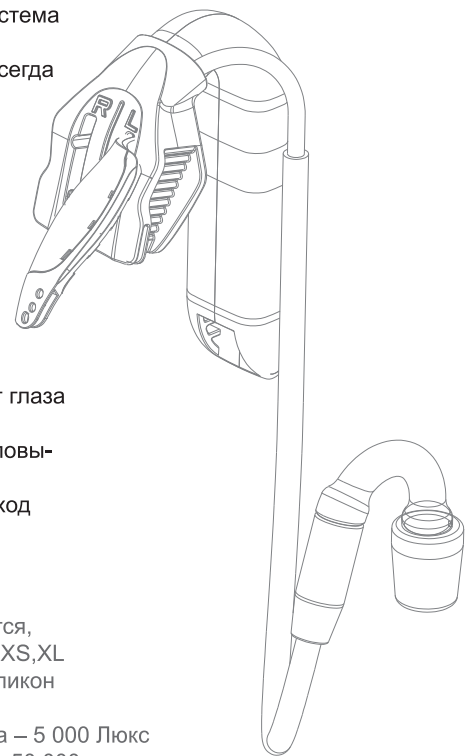
eBite Аспирационная система

Зарядка – 1 час Непрерывная работа – 2 часа