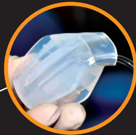
Распорка для челюсти